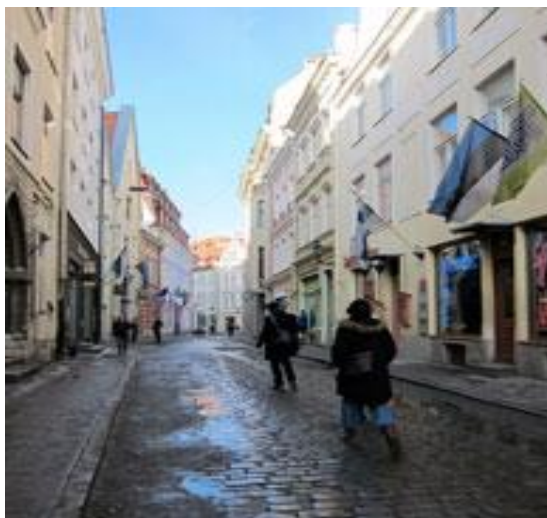
FIGUR 3 - GAMLA STADEN I TALLIN, ESTLAND.

I Estlands huvudstad, Tallinn, håller organisationen Continuous Action till. Under en månad får du möjlighet att arbeta med barn på förskolor och fritidsgårdar. Du kan också vara med i arbetet att dela ut mat till människor som har det sämre ställt.