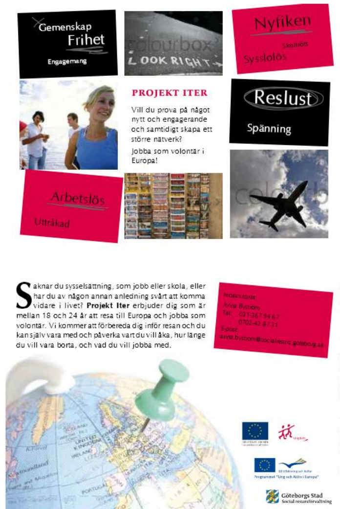
FIGUR 1 – ”FLYER” FRÅN ITER-PROJEKTET