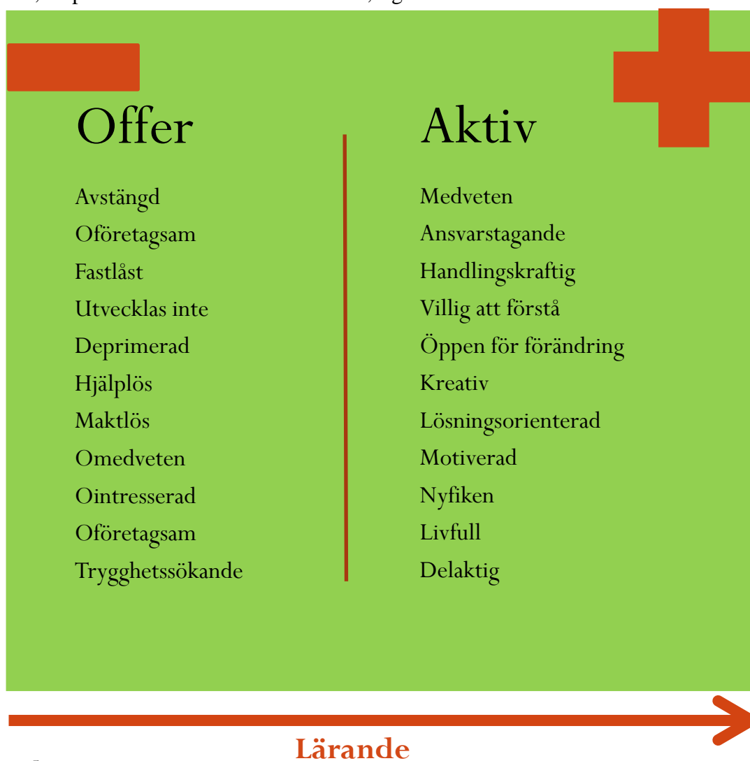
FIGUR 5 OFFER – AKTIV

Mycket av arbetet med unga i utanförskap går ut på, som vi ser det, att flytta det individuella tänket, en position från "Offer" till "Aktiv", figuren nedan illustrerar detta.