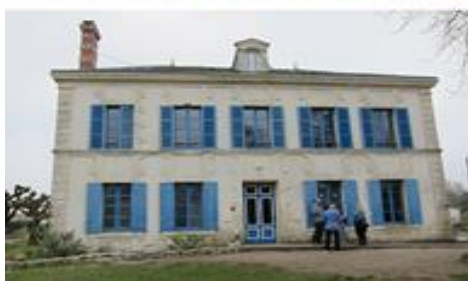
Le Village des Jeunes, i den lilla bergsbyn nära Marseille och La Maison des Bateleurs i byn Montendre, en timma från Bordeaux.